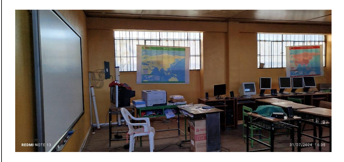
AULA DE INNOVACIÓN PEDAGÓGICA